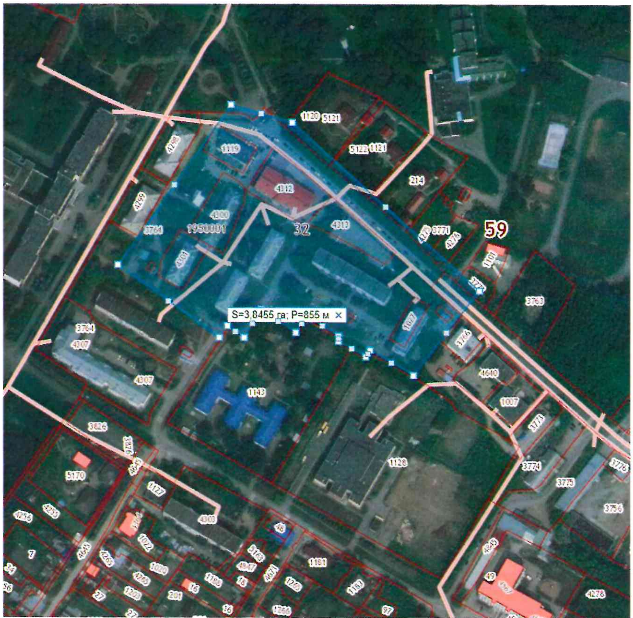
Схема для разработки проекта планировки и проекта межевания части территории с. Усть-Качка Усть-Качкинского сельского поселения Пермского муниципального района, включающего земельный участок под многоквартирным домом № 7 по ул. Новый поселок